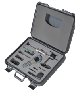
Kit de pochette de transport rigide MMS2