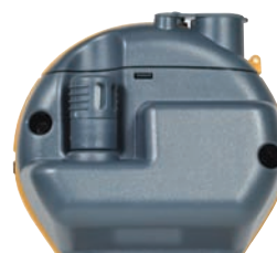
Sonde Quikstick ST POL78751, standard avec tous les kits MMS2 et dotées des mêmes performances que la sonde Quikstick standard. Une sonde Quikstick ST peut rester connectée au MMS 2 tout en utilisant les broches.

Il est possible de relever et de consigner facilement les valeurs de plusieurs sondes Hygrostick. Les valeurs de l'humidité peuvent être relevées en utilisant des manchons d'humidité ou un caisson d'humidité. Il convient d'utiliser des sondes Hygrostick, et non pas Humistick, pour cet essai.