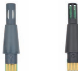
Sonde Hygrostick, référence POL4750, pour les applications fortement exposées à l'humidité.

Le MMS Plus peut être utilisé avec trois types de sonde d'humidité interchangeable : la sonde Hygrostick, la sonde Quikstick et la sonde Quikstick ST. La sonde Hygrostick (grise POL4750) peut être utilisée pour les applications fortement exposées à l'humidité, comme la mesure du béton. La sonde Quikstick (noire POL8750) est un capteur à plage complète, usage général et réponse rapide.